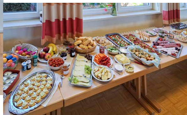
Eindrücke vom Gottesdienst am Ostermontag